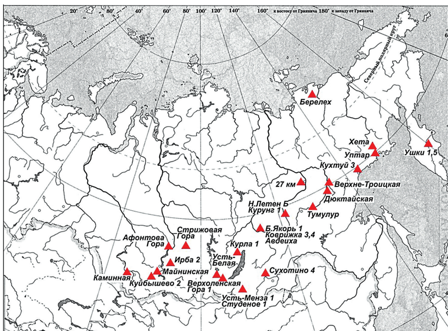
Рис. 1. Карта основных упомянутых в тексте позднепалеолитических памятников Сибири Fig. 1. Map showing the location of the main Late Upper Paleolithic sites of Siberia mentioned in the text

Поведём наш обзор с юго-запада на северо-восток, последовательно рассматривая памятники Алтая, Енисея, Ангары, Забайкалья, Якутии, Камчатки (рис. 1) и далее в Америку. Я намеренно опускаю стоянки юга Дальнего Востока России (Приморье, Приамурье, Сахалин), поскольку данные индустрии должны рассматриваться в контексте сравнения с палеолитом Северной Японии, Северо-Восточного Китая и Кореи, что далеко выходит за рамки настоящей работы.